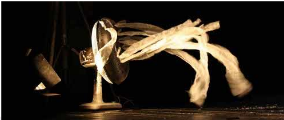
"Взять кусочки эксельсиора, нарезать их и привязать к вентилятору. И он будет их развеивать как в фильме Тарковского".

Хотя про меня говорят, что я современный и новатор. Я не циник и не сноб и матерщинник даже. Но когда в пьесе кроме слова ... (из трех букв) ... ничего нет, мне становится неинтересно просто. Это имеет право быть, но мне это неинтересно ставить. И я всегда говорю, что ваша «актуальная» драматургия будет проигрывать Интернету и СМИ – театр погибает. Он загнулся по своей ущербной тенденции. Вообще мне нравится тенденция 20 века в том, что вне философии никакого творчества нет. Я считаю, что творчество без философии – это тупое и бесполезное ремесло. Если нет философической подложки, то это выстрелы вхолостую. Мне приятна такая тенденция, что в 20 веке все философские направления, течения и мысли были реализованы не в философских вонючих трудах и трактатах, а в литературе, в романах. Скоро все устанут от месседжей, устанут от лозунгов, и чувственное начало возьмёт верх.